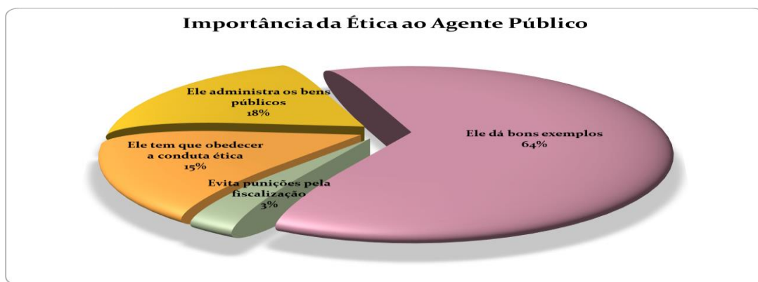
Figura 2: Fonte – Elaborada pelo autor

Os dados apresentados no gráfico acima denotam que a grande maioria dos colaboradores entrevistados consideram a ética fator indispensável no ambiente colaborativo e que o gestor tem a responsabilidade em passar os bons exemplos para os demais membros da secretaria. Uma parcela de 64% dos colaboradores considera ética fator fundamental e importante para a atuação do agente público.